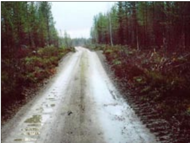
Horsmaniemen tiekunnan osakkaat ovat tyytyväisiä kunnostuksen tuloksiin. Tiekunta korjasi tien omarahoituksella. Vasemmalla tie ennen kunnostusta, oikealla kunnostuksen jälkeen.

alkaa uida tiessä hermostuttavan syvällä, kannattaa kutsua tiekunnan kokous pikaisesti koolle!