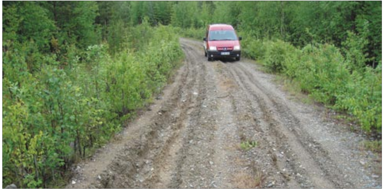
Kelirikko aikaan pahasti raiteille ajatun tien runko joudutaan muotoilemaan uudestaan ja ajamaan lisää murskettä tien pintaan.